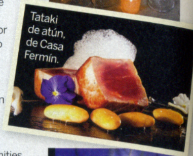
Tatakí de atún, de Casa Fermín.