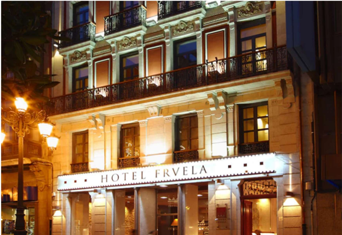
Fig. 21. Hotel Fruela. Fachada.

El primero que hay que destacar es el hotel Fruela, en la calle Fruela de Oviedo, donde se aplicó el concepto arquistoria, ya que tomo la referencia histórica del Reino Astur, y lo traslado a la esencia del local. Hay varias referencias al prerrománico asturiano en su decoración, fusionando la esencia histórica de su arquitectura con la innovación en el moderno diseño de sus instalaciones y habitaciones.