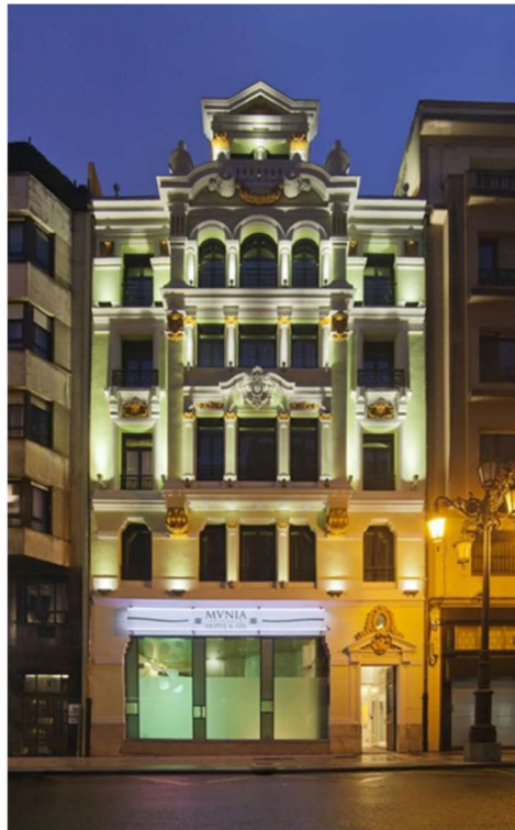
Fig. 22-23. Hotel Munia.