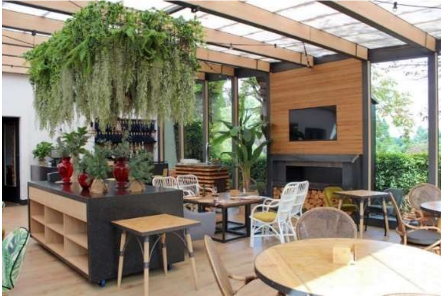
Fig. 30. Interior del comedor.

Colaboración en proyecto y ejecución con Planeamiento Y Diseño Urbano de espacios de comedores y ampliación con cierre acristalado de terraza exterior.