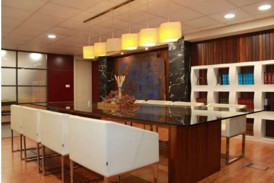
Fig. 28. Sala de juntas.

Aula de la Sidra en Escuela de Hostelería de Gijón