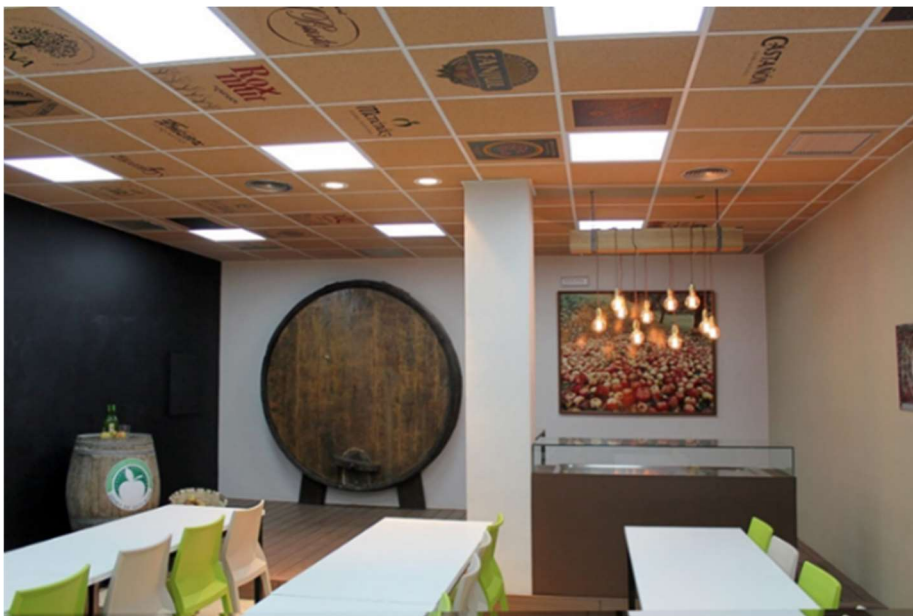
Fig. 29. Aula.

Aula de la Sidra en Escuela de Hostelería de Gijón