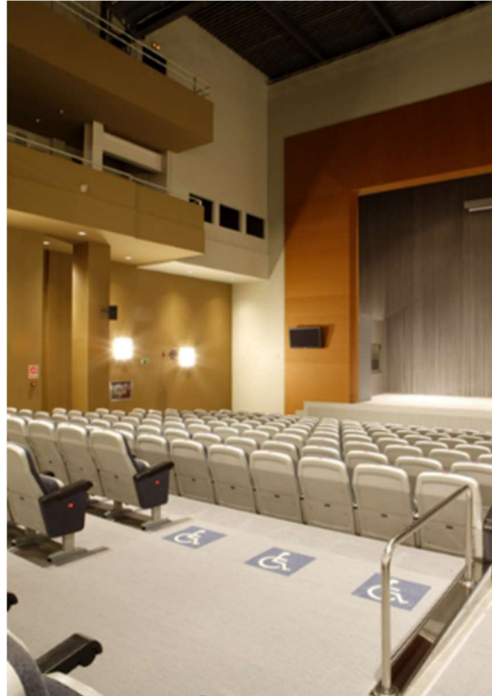
Fig. 32. Sala