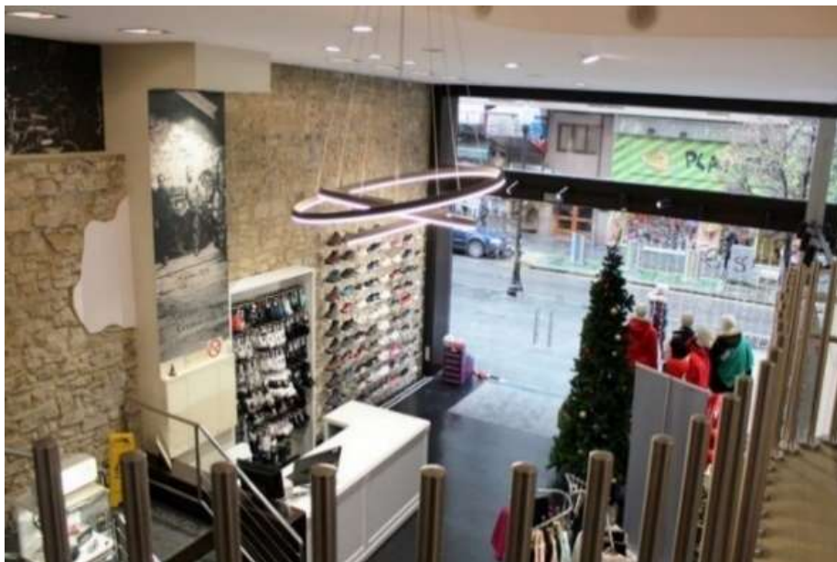
Fig. 31. Proyecto y ejecución de reforma de local comercial para venta de artículos deportivos.