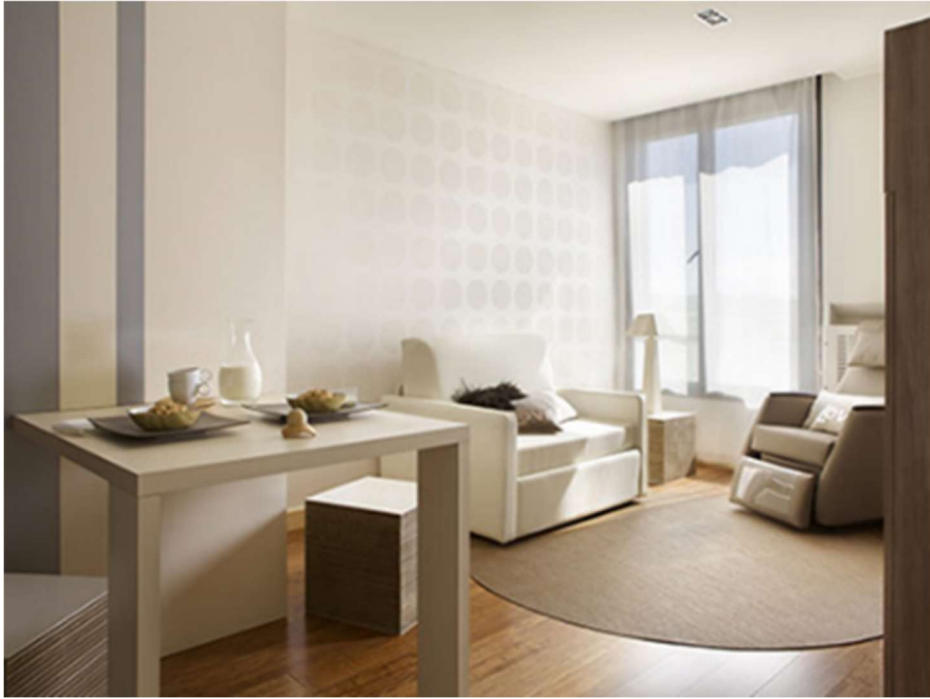
Fig. 34. Interior.

Lo que lo hace especial es que es un piso totalmente adaptado para personas con discapacidad física, sin que su decoración se vea afectada por este condicionamiento.