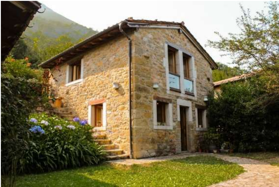
Fig. 24-25. La Pumarada de Quirós.

Se trata de un proyecto integral de rehabilitación y adaptación de antiguas construcciones