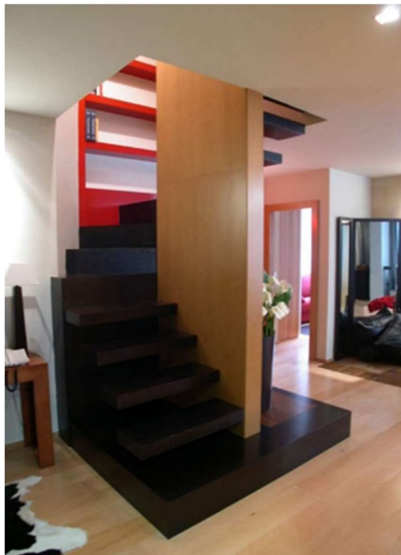
Fig.26-27. Vivienda dúplex en Gijón. Salón, Archivo autora.

.Proyecto, ejecución y amueblamiento integral de vivienda nueva, donde la luminosidad y el confort parece una de las premisas principales de este proyecto. La paleta cromática navega entre colores neutros con toques vivos de color.